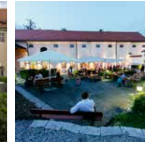
BIERGARTEN max. 90 Personen