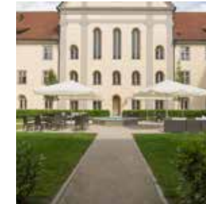
KREUZGARTEN max. 100 Personen