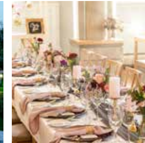
GEWÖLBESAAL max. 100 Personen

Kloster Holzen Hotel GmbH · Klosterstraße 1 · D-86695 Allmannshofen · Tel +49 (0)8273/9959-0 · Fax +49 (0)8273/9959-1504 hochzeit@kloster-holzen.de · www.kloster-holzen.de